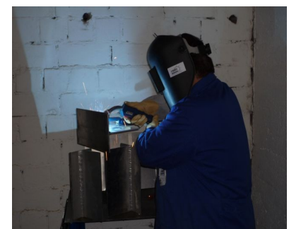
MAG MIG NE