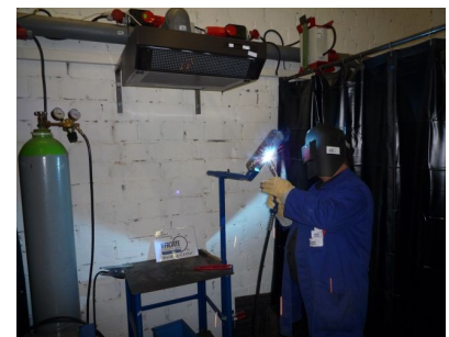
MAG MIG CrNi